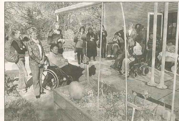
Le jardin ne compte pour l'heure que deux grands bacs réalisés sur mesure, mais d'autres devraient bientôt suivre.